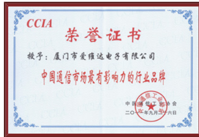
中国通信市场最有影响力的行业品牌