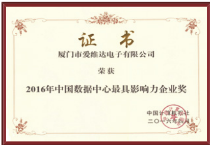
中国数据中心最具影响力奖