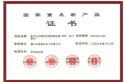
国家重点新产品证书