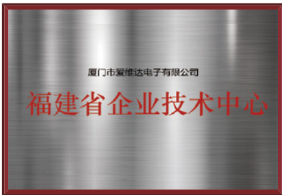
福建省企业技术中心