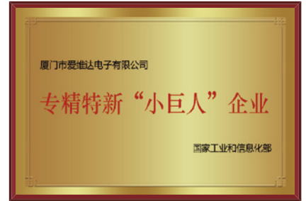
国家专精特新“小巨人”企业