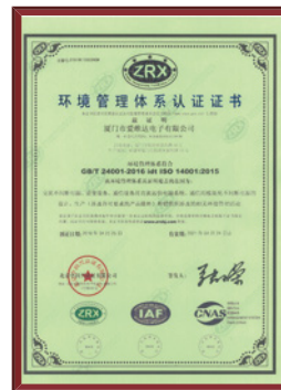
环境管理体系认证证书