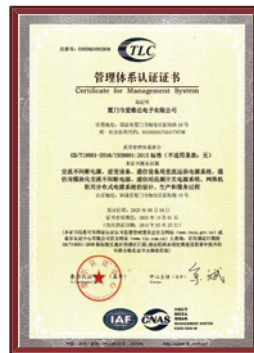
质量体系认证证书