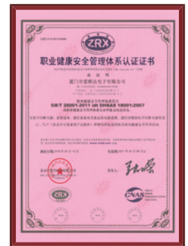
职业健康安全管理体系认证证书