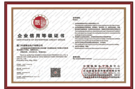
企业信用等级证书