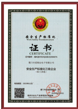
安全生产标准化三级企业