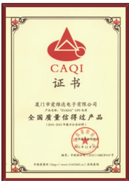
全国质量信得过产品